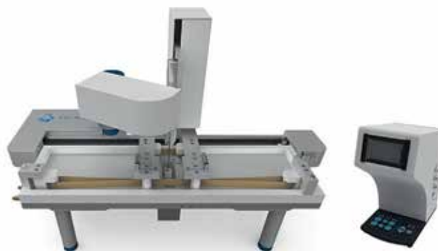
KSV NIMA Langmuir-Blodgett Ribbon Barrier Trough.

По мере приближения поверхностного натяжения монослоя к поверхностному натяжению водной субфазы (73 мН/м) поверхностно-активное вещество начинает просачиваться между барьерами ванны. KSV NIMA Langmuir Ribbon Barrier Trough предотвращает утечку с помощью ленточных барьеров и контролируемого сжатия монослоя.